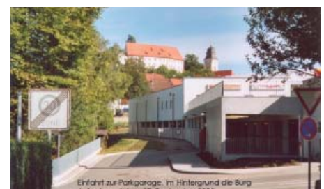
Einfahrt zur Tiefgarage. Im Hintergrund die Burg