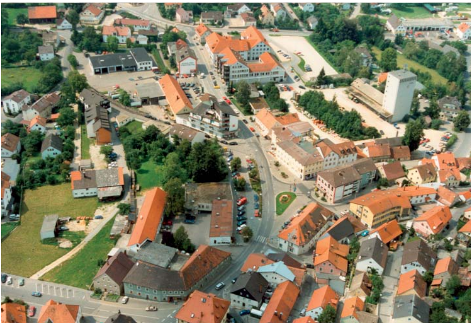
vorher - innerstädtische Brache

Gesamtplanung: Architekturbüro Wolf Burgstraße 7 92331 Parsberg