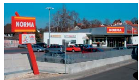
Fertig gestellter Discounter