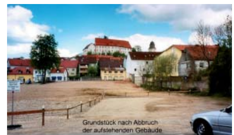
Grundstück nach Abbruch der aufstehenden Gebäude