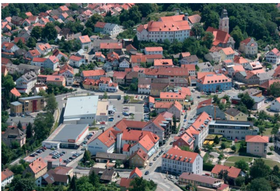
nachher - entwickelte Brachfläche