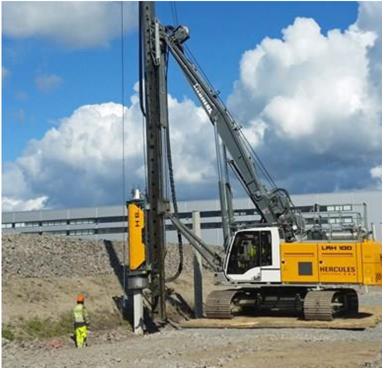
Abbildung 2.3: Rammgerät zur Pfahlgründung der Masten