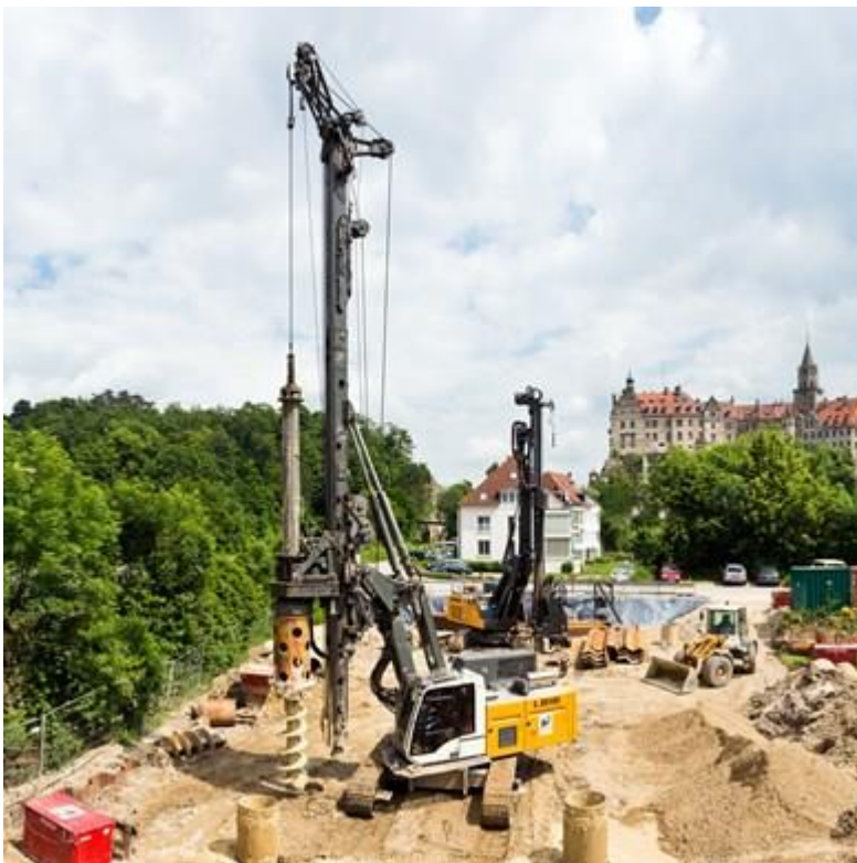
Abbildung 2.4: Bohrgerät zur Pfahlgründung der Masten