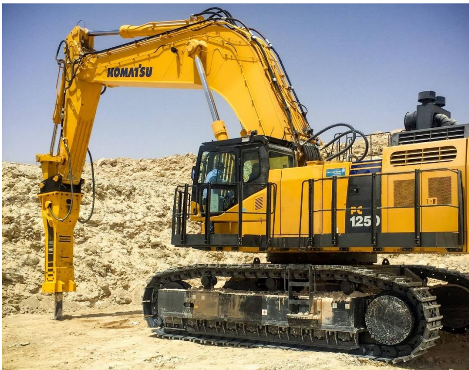
Abbildung 2.1: Bagger mit Meißelaufsatz (Hydraulikhammer)