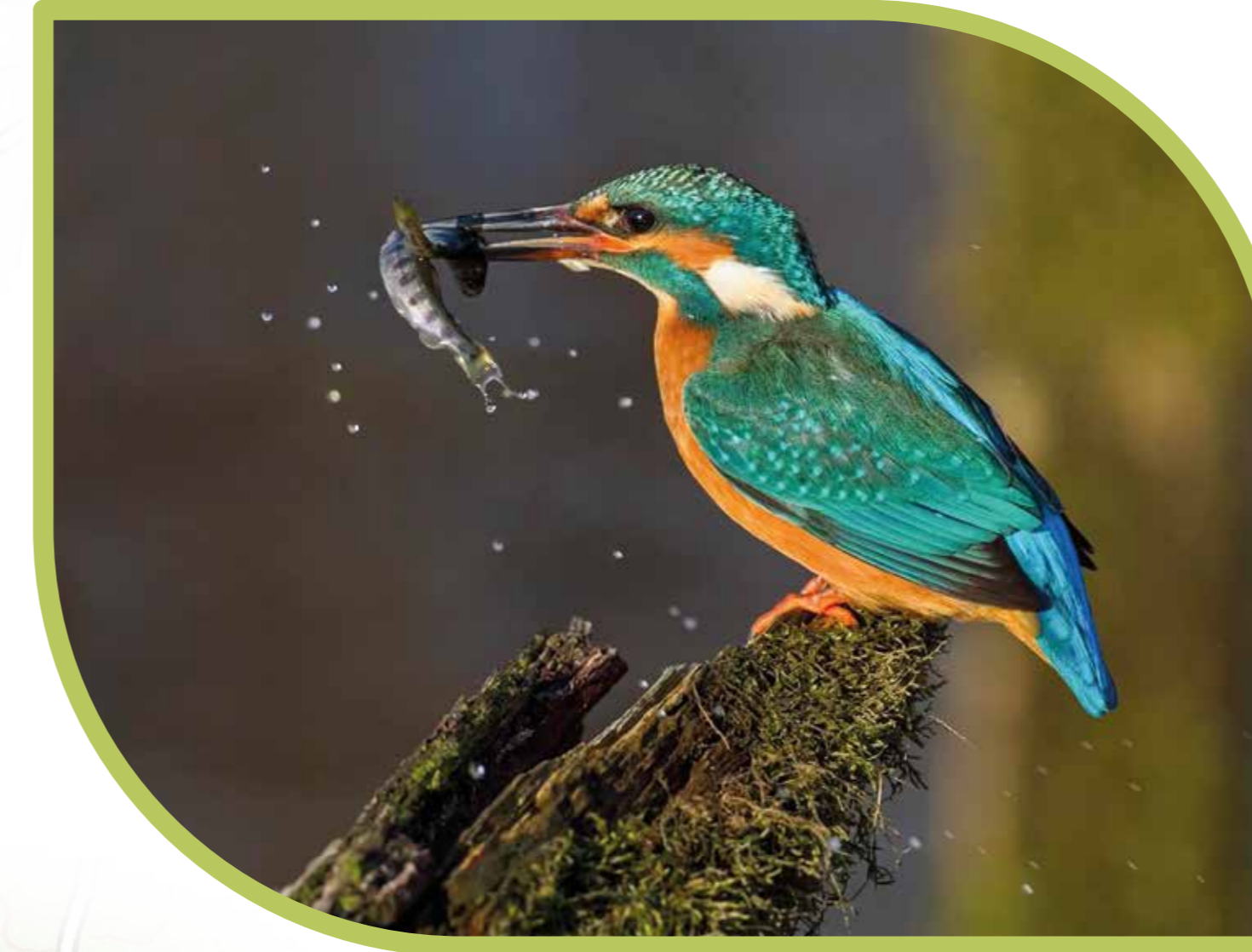
Der Eisvogel nutzt die Pegnitz als Jagdgebiet.