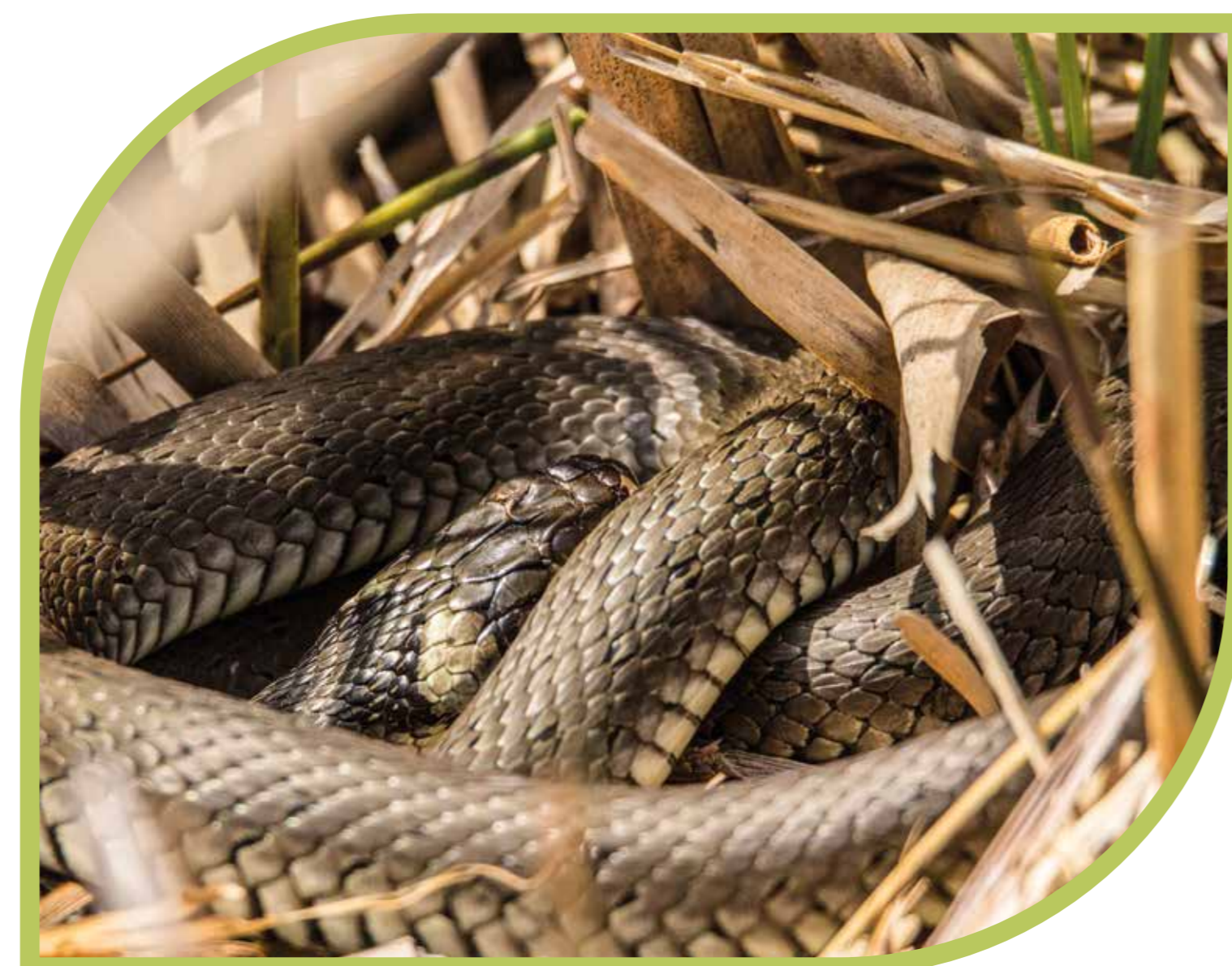
Reptilien wie die Ringelnatter finden an den Kammerweihern Beutetiere wie Frösche oder Molche.