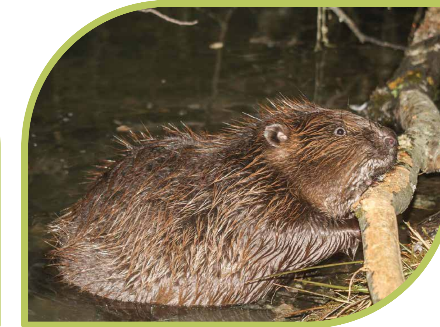
Der Biber sorgt für Totholz und Überschwemmungsflächen und gestaltet den vielfältigen Lebensraum entlang der Pegnitz mit.