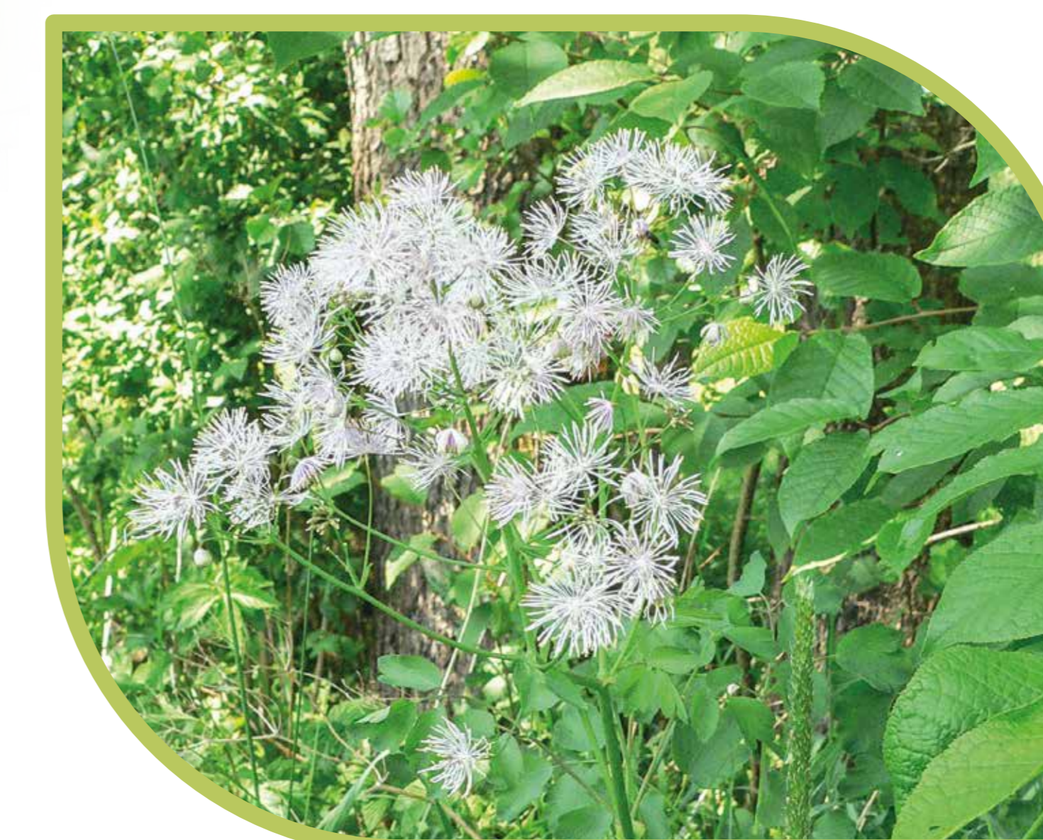
Auf den feuchten Böden der Auwälder wächst die Akeleiblättrige Wiesenraute mit ihren typisch hellvioletten, büscheligen Blüten.

Freilaufende Hunde stellen vor allem in der Aufzuchtzeit der Jungtiere eine große Gefahr für die Tierwelt dar. Leinen Sie daher Ihre Hunde an und bleiben Sie auf den Wegen!