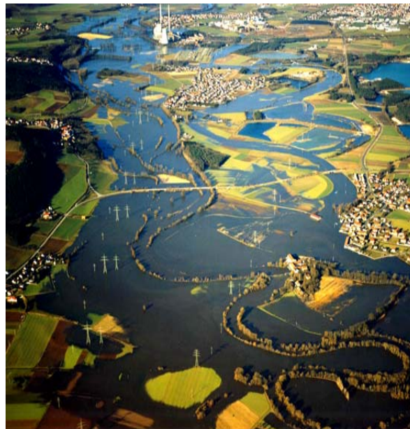
Hochwasser an der Naab